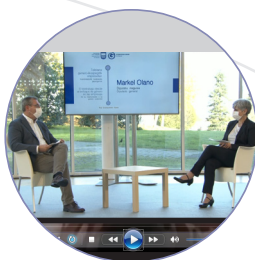
Bivenida Markel Olano Diputado general

En la sesión de aprendizaje hemos reflexionado sobre el impacto de género que han tenido y que tendrán estas nuevas formas de trabajo y de cultura empresarial, y cómo abordar estrategias que permitan reducir las desigualdades de mujeres y hombres en entornos laborales sostenibles.